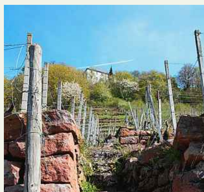
Der Blick auf die Treppe lässt ahnen, wie mühsam der Weinbau in steilen Lagen ist.

Bedeutung für Weinbau, Denkmalpflege und Naturschutz. Für das Projekt ausgewählt wurden sechs Gebiete in Baden-Württemberg, Bayern und der Schweiz: der Schlossberg bei Klingenberg am Main, die Rebterrassen von Rosswag im Enztal, der Schloss- und Mauerberg in der Ortenau, der Castellberg im Markgräfler Land und die Weinberge von Salgesch im Kanton Wallis in der Schweiz. (kü)